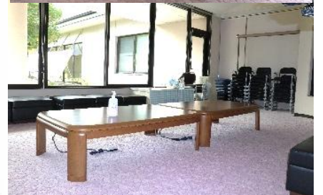
ボランティアルーム