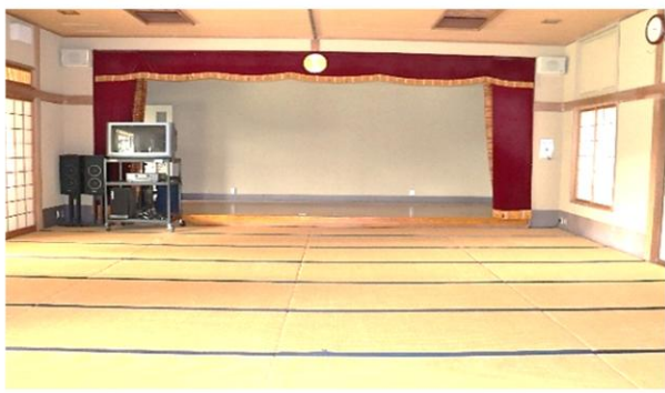
ふれあいの間 (138.65 m 2 )