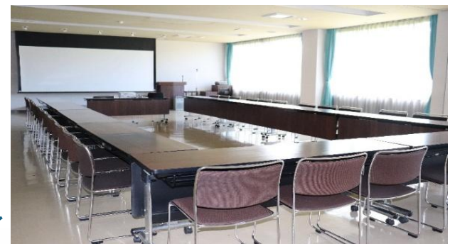
講習、研修室 (138.15 m 2 )

120 名収容できるホールです。各種研修会に広く利用できます。また仕切れば中会議ともなります。