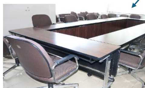
会議室 (41.73 m 2 )